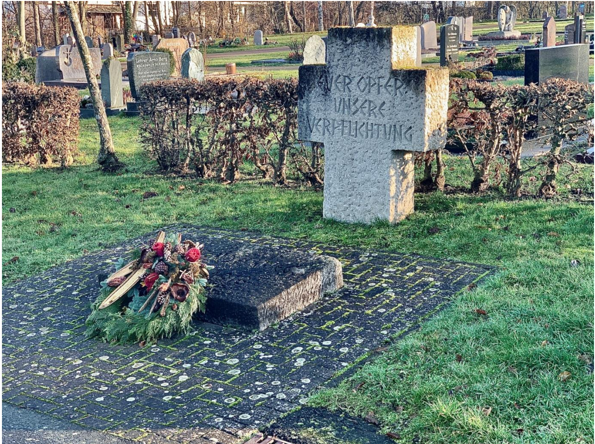
Sühnekreuz auf dem Friedhof Guxhagen