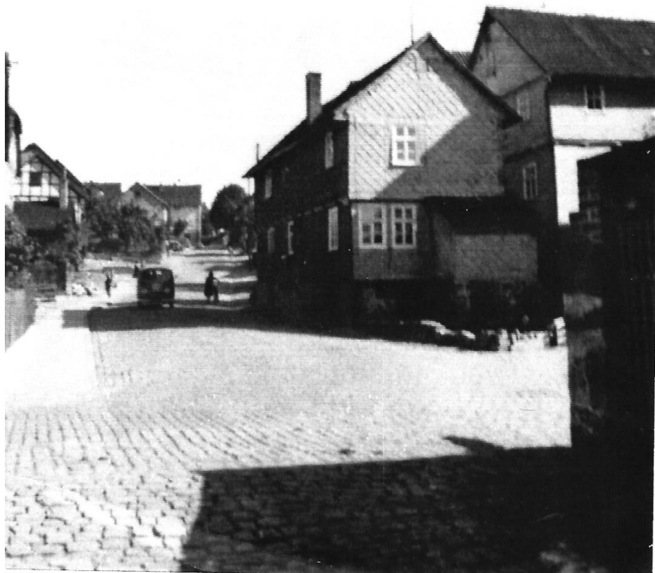
Blick auf die Selle von der Toreinfahrt Bäckerei Most, rechts das Dampfschiff

Bis zum Abbruch des Hauses hat man nicht mehr von Opfermanns Haus gesprochen, sondern nur noch vom Dampfschiff.