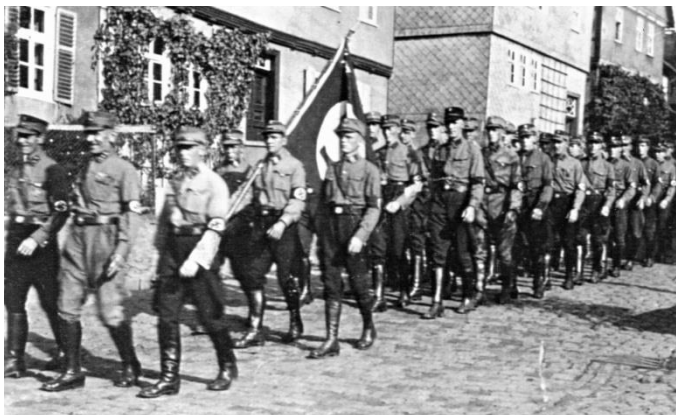
1936 Aufmarsch der SA auf der Sellestraße

Als der Druck der Nazis auf die jüdische Bevölkerung immer größer wurde, begann auch der Leidensweg der Sellestraßenjuden und vor lauter Verzweiflung verkauften sie ihre Häuser noch vor der Novemberpogrome 1938 und Verliesen Guxhagen.