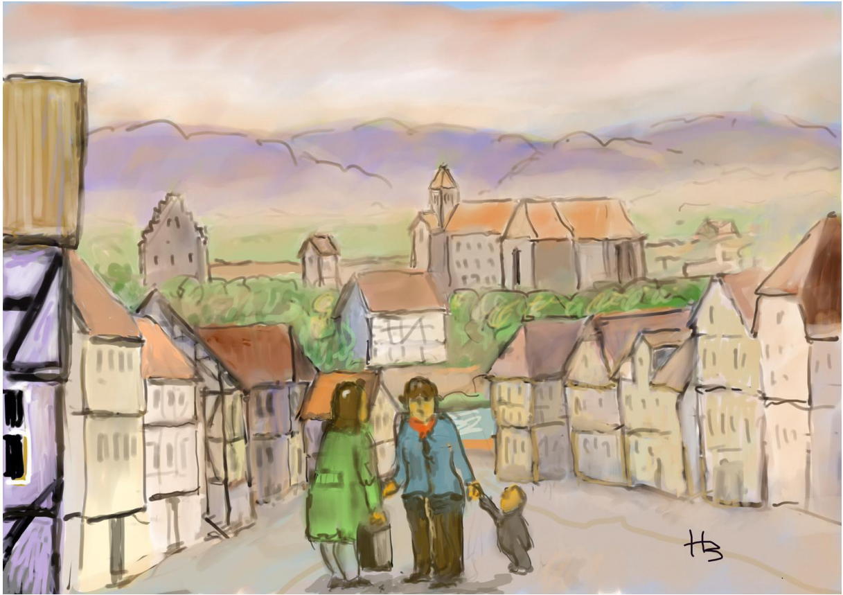
Die Sellestraße, gemalt von Hartmut Benderoth