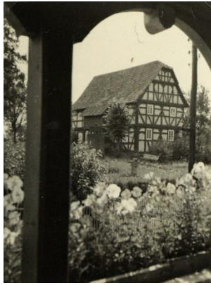
Kirche vor dem Umbau 1952