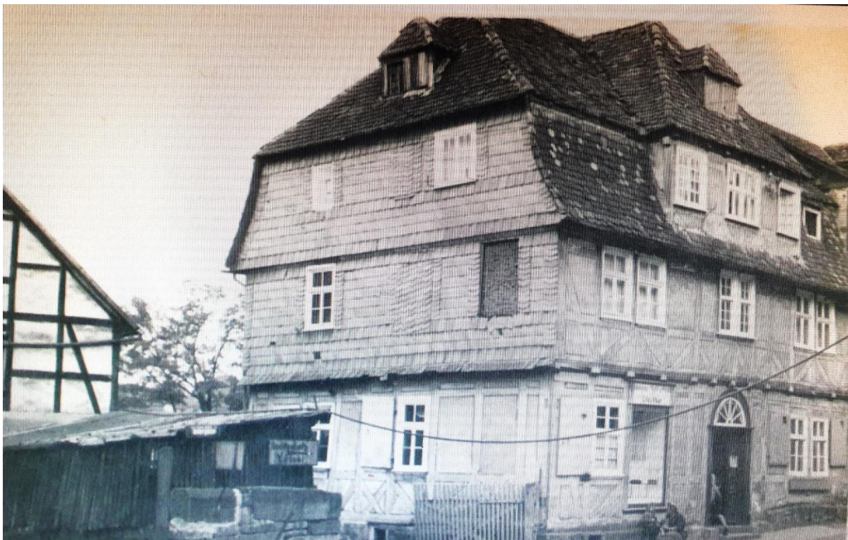
Bäckerei Most 1920

Von dieser Auflistung ist nur noch die Bäckerei Most und die Schreinerei Wolfram, unter einen anderen Besitzer, in der Sellestraße übrig geblieben.