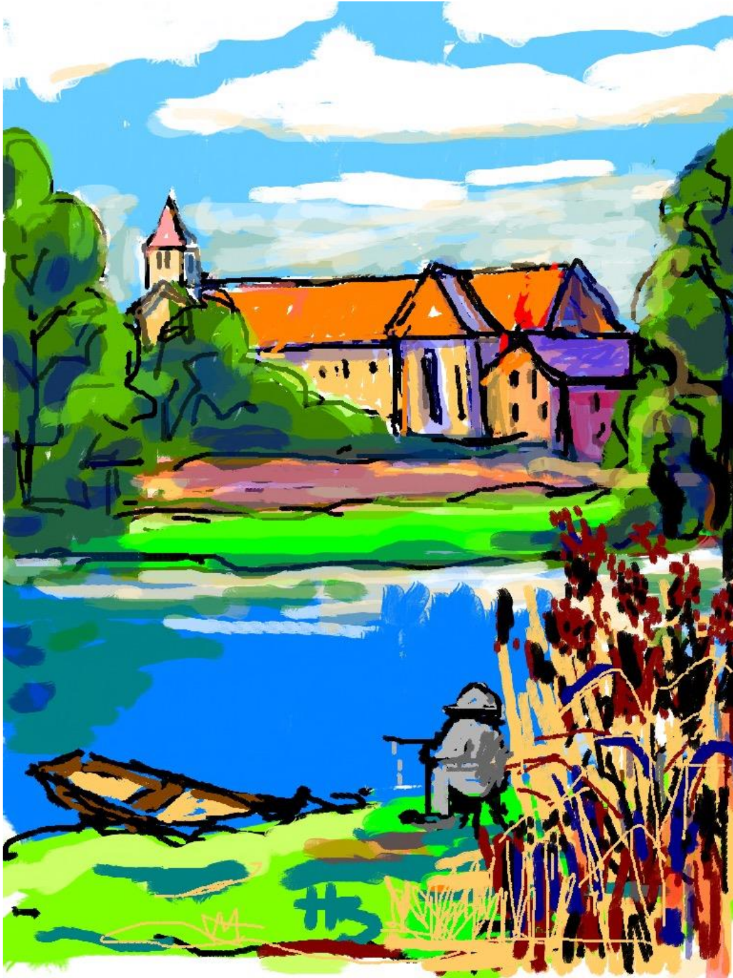
Angler an der Schiffstatt mit Klosterblick Maler Hartmut Benderoth