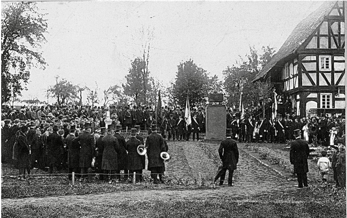
Volkstrauertag 1930, Gedenkfeier vor Denkmal des 1. Weltkrieges.

Um den Toten des 1. Weltkrieges weiter zu gedenken, wurde die Gedenkstätte zum Ehrenhain für den 2. Weltkrieg, mit der neuen Gedenkplatte des 1. Weltkrieges, vor das Sühnekreuz, erweitert. Die Ansprache für die Erweiterung im Ehrenhain hielt Bürgermeister Harald Kraß am 31.08.191979.