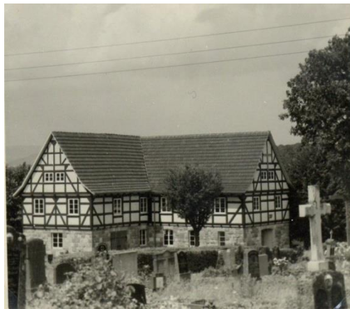
Friedhofskapelle mit Leichenhalle nach dem Umbau 1952