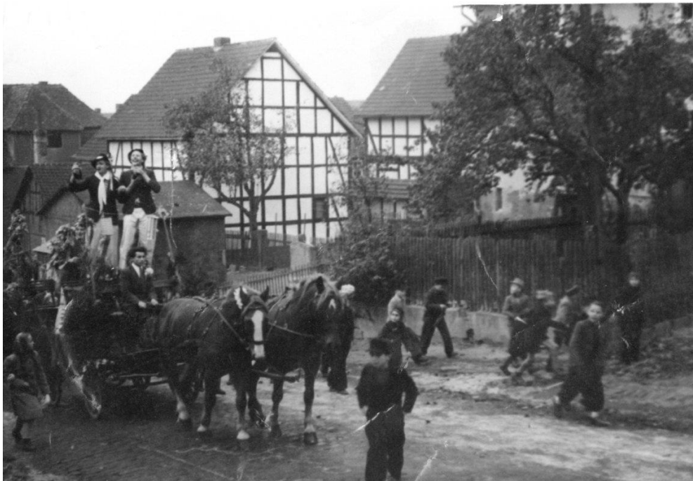
Kirmesumzug 1949 auf der Sellestraße